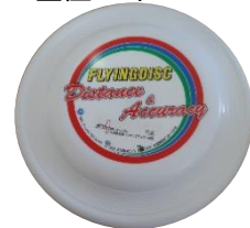
ディスク 重量約100g やわらかな素材