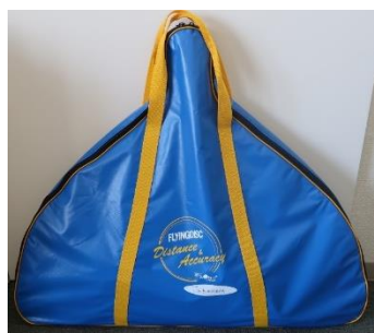
専用キャリーバック

専用キャリーバックに、アクキュラシーゴール1基、ディスク10枚、フラッグ1本が入っています。アクキュラシーゴールは組み立て式になっています。