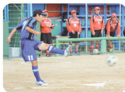
サッカーボールを使用 キッカーはボールを蹴って進塁