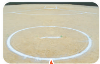
ピッチャーズサークル

投手が、野手からの返球を受け、ピッチャーズサークル内でボールを保持した時点で、試合が停止となり、走塁中のランナーは元の塁に戻るというルールです。