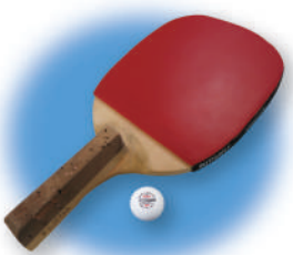
使用する用具は 一般の卓球と同じ