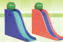
ボウリングスロープ

し たい しょう 肢体に障がいがあり、ボールを自 ぶん な 分で投げることができない人は、ボ ウリングスロープ(滑り台のような もの)を使って投球します。車いす利用 者で自分の力で投げられる人は、車 いすに乗ったまま投球します。