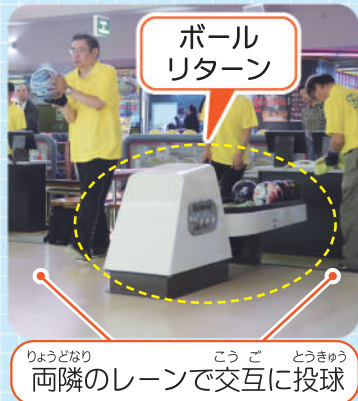
りやうどなり 両隣のレーンで交互に投球

レーンごとにコン ディションが かわる ので公平性を保つた ために、大会ではこの方 式を採っています。