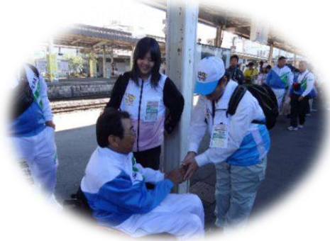
長崎県ボランティアの皆さんと