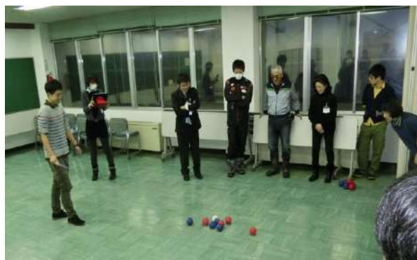
実技(ボッチャ)の様子