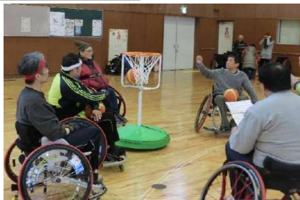
慣れない実技に奮闘

平成26年11月15日、22日、29日、12月6日、13日の全5日間の日程で、競技団体の指導者を対象とする中級障がい者スポーツ指導員養成講習会を開催しました。今回の修了者は、日本体育協会公認スポーツ指導者の資格を持つ10名の方です。今後、障がいを理解した競技指導者として大いに活躍されることを期待しています。