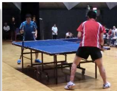
卓球デモンストレーション