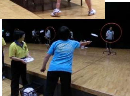
フライングディスクに挑戦

しあわせ福井スポーツ協会の設立を記念して、障がい者スポーツを「聞く、見る、体験する」イベント「はじめよう！ひろげよう！障がい者スポーツ ～パラリンピアンとともにスポーツの楽しさを体験しよう～」を、平成26年9月23日（火・祝）に、福井県生活学習館において開催しました。