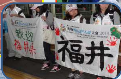
第4回 福井県障がい者スポーツ大会