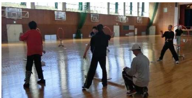
フライングディスク 強化練習の様子

ール、バレーボール、サッカー、フットベースボール)で、中央の指導者による練習、県外チーム等との対戦などを行い、一人ひとりが着実に力をつけています。