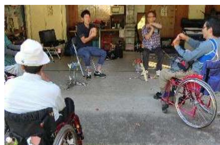
理学療法士による指導