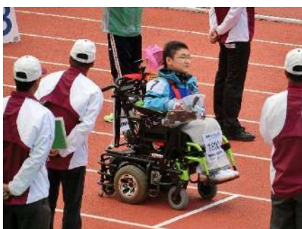
陸上競技(スラローム)